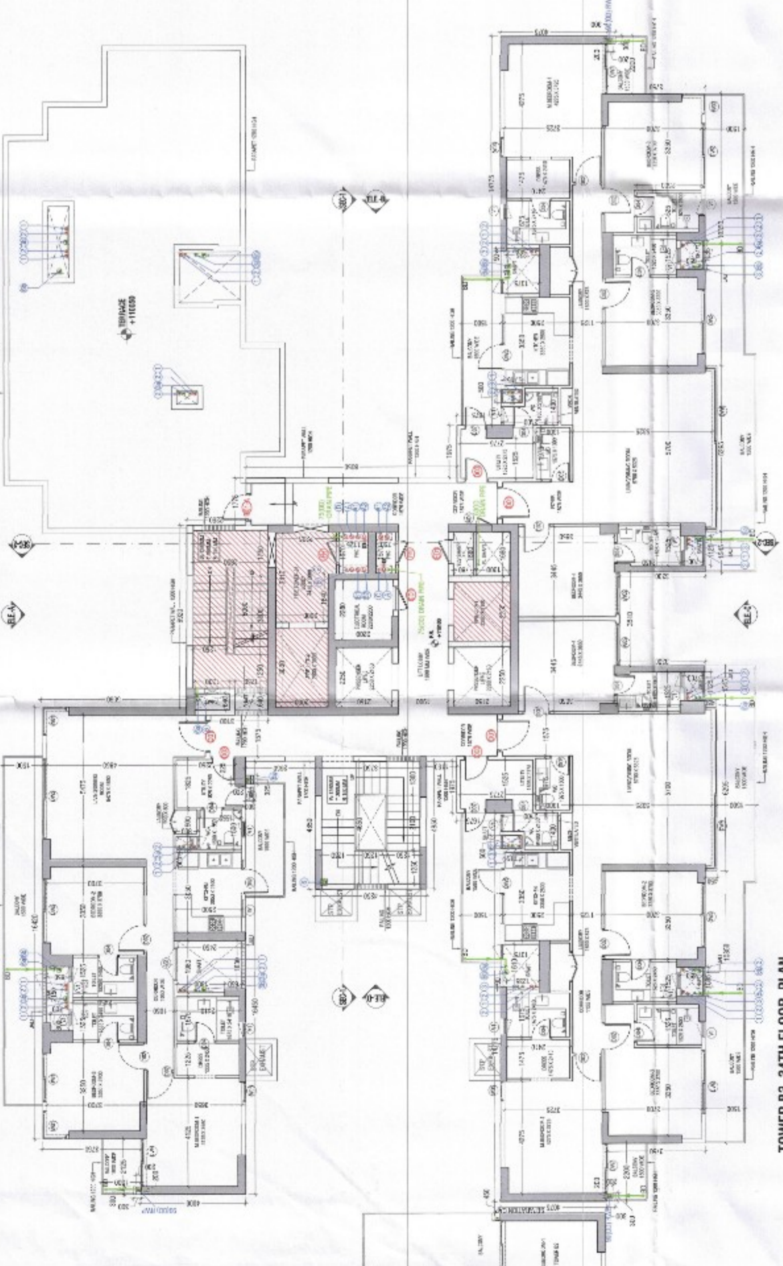
TOWER B3_35TH FLOOR PLAN