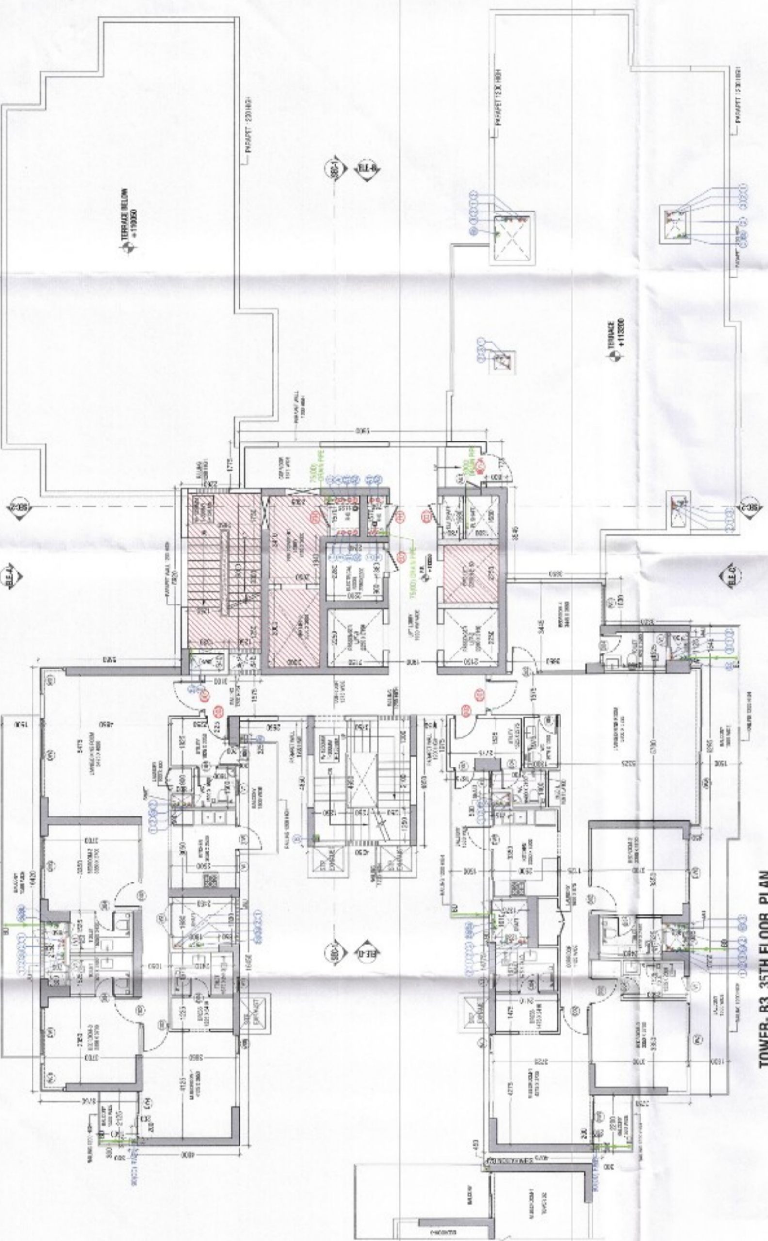
TOWER B3_34TH FLOOR PLAN